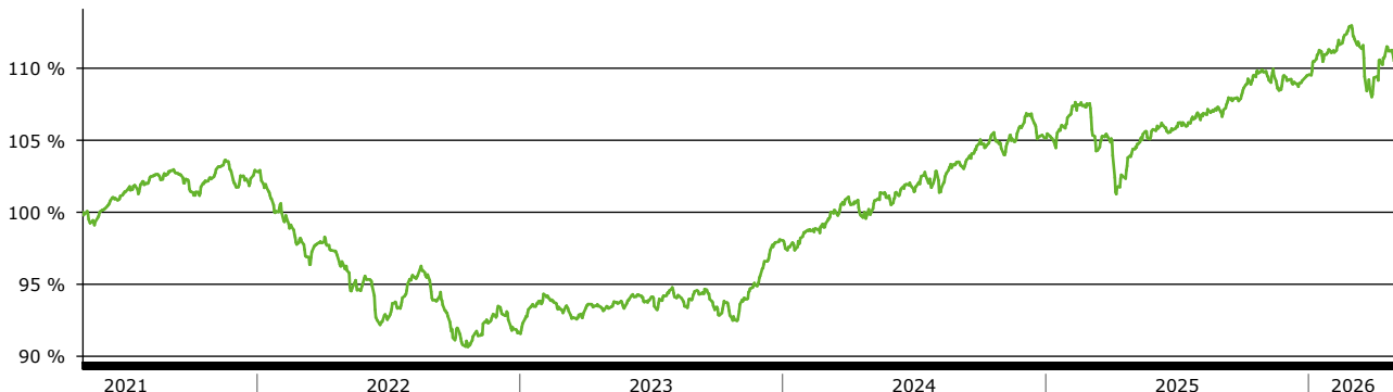
— Premium Vermögensplan